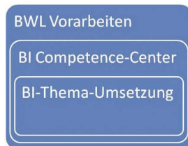
Struktur des BI-Prozesses

Business Intelligence ist ein Prozess, und nur die Einführung ist ein Projekt! Die Strategie-Ziele werden mittels BI regelmässig überprüft. BI führt zu einem Wettbewerbsvorteil, weil wir unser Geschäft spüren und verstehen! Business Intelligence braucht Knowhow!